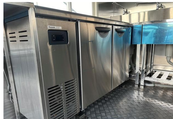
冷蔵コールドテーブル (170L)