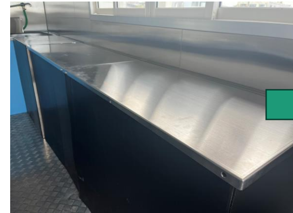
折りたたみ作業台