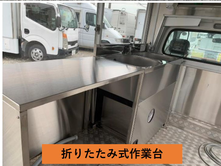
折りたたみ式作業台