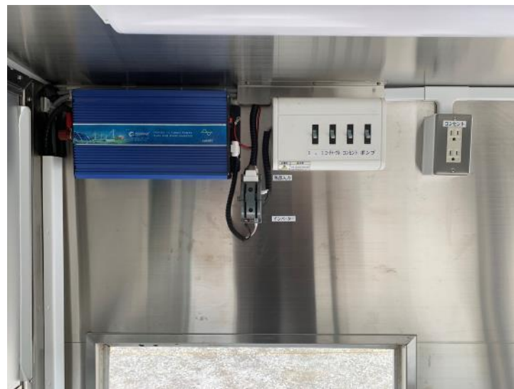
分電盤、インバータ